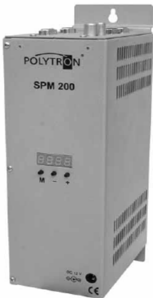
Základní jednotka pro dva moduly