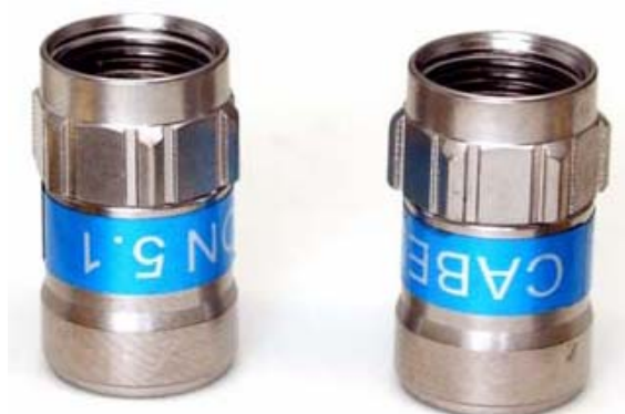
Self-Install™ konektory pro satelitní přijímače kabelové modemy, set top boxy.

Nová generace samoinstalačních konektorů firmy Cabelcon nahrazující nekvalitní šroubovací konektory často používané pro domovní instalace. Instalace Self-Install™ konektorů je jednoduchá, rychlá a precizní.